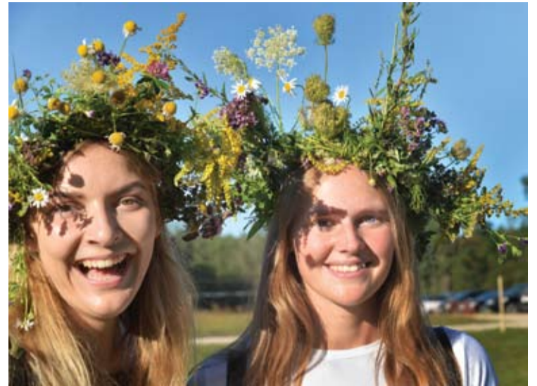
Merginos puošėsi vainikais.