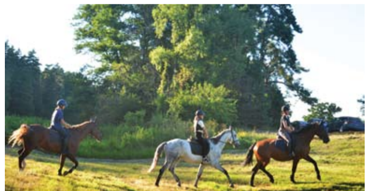
Šventosios pievose šuoliavo sporto klubų „Vilartas“ ir „Mikadoras“ žirgai.