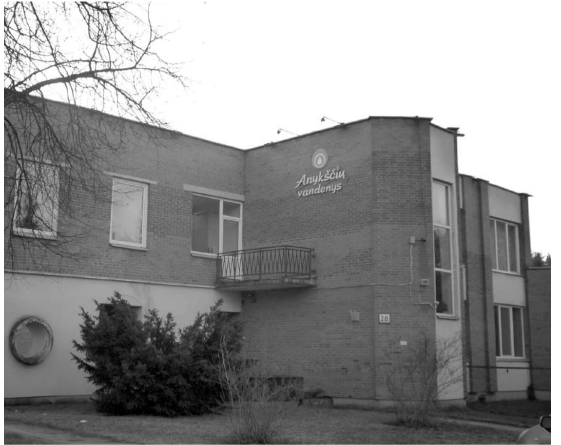
Kurkliuose atliekant projektą nutiesta 4 km. 955 m. naujų vandentiekio tinklų bei 6 km. 249 m. naujų savitakinių ir slėginių nuotekų tinklų.

Direktorius neslėpė, kad kurkliečiams dabar taikoma išskirtinė kaina, nes UAB „Anykščių vandenys“ yra spaudžiama terminų. Tačiau tuomet, kai bus surinktas reikiamas abonentų skaičius, prijungimo prie vandentiekio ir nuotekų tinklų kaina ženkliai kils, nes šiuo metu „Anykščių vandenys“ dirbti tik už medžiagų savikainą verčia aplinkybės. Kitaip tariant – „akcinių