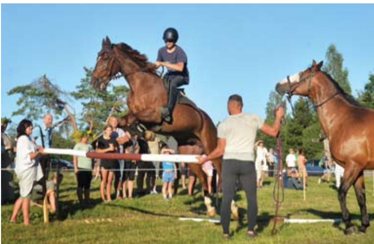
Šuolis per žmonių laikomą kliūtį.