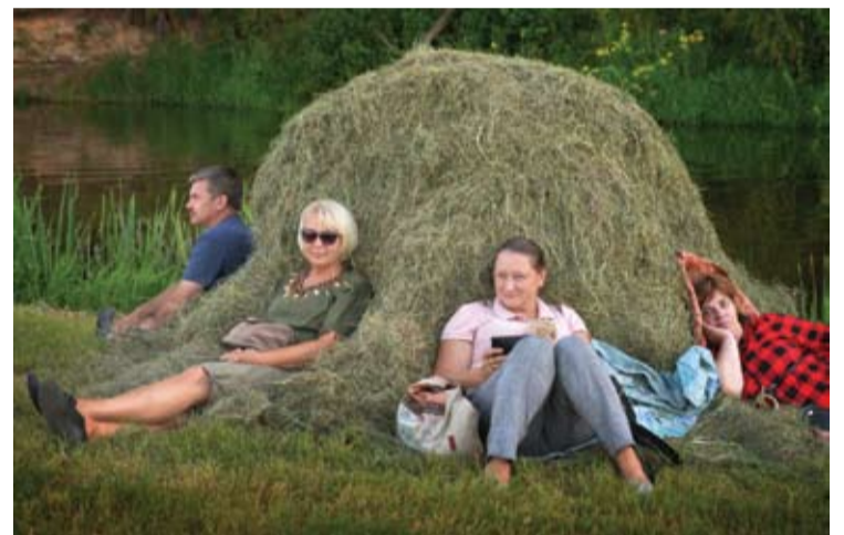
Palaimingas poilsis šieno kūgyje.