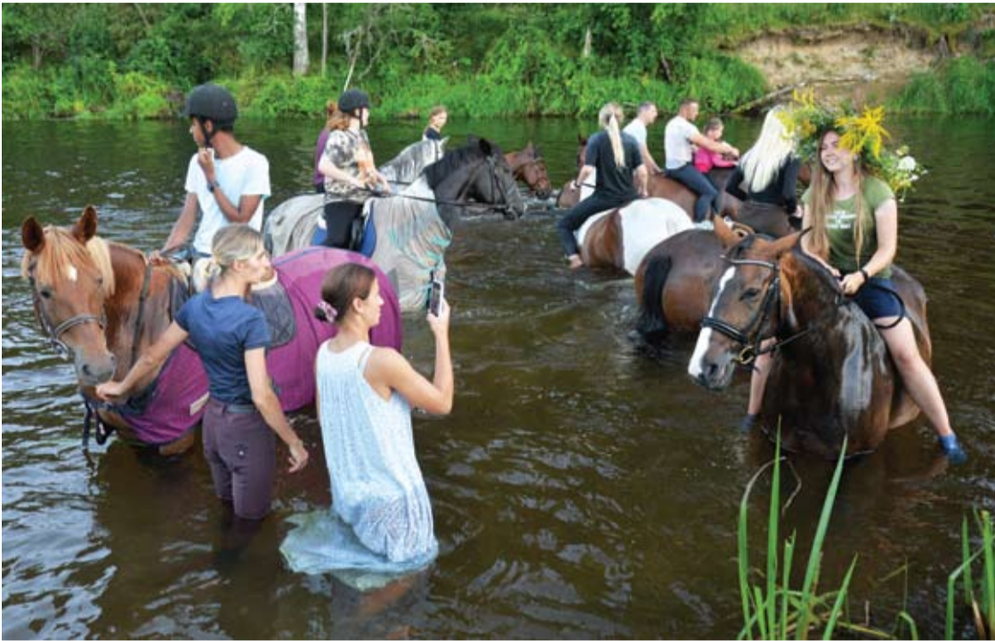
Labiausiai susirinkusieji laukė žirgų maudynių.

Ketvirtadienį, rugpjūčio 11 – ają, Žirgo take, poilsiavietėje prie Šventosios upės, vyko tradicinė, jau vienuoliktoji Naktigonė. Šventę gausiai susirinkusiems anykštėnams ir svečiams dovanojo Aukštaitijos saugomų teritorijų direkcijos Anykščių regioninis parkas.